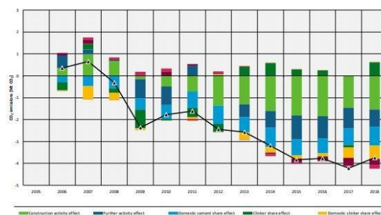
Figure 10: Decomposition of the development of CO 2 emissions from cement production since 2005 in France

Alors que Demathieu bard teste son premier bâtiment bas carbone, les émissions de CO2 liées au béton n'ont cessé de baisser en France